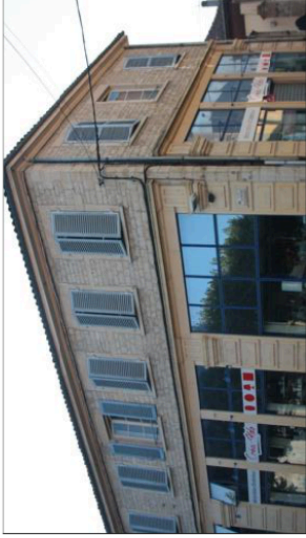
L'hôtel des postes aujourd'hui.

1945 qu'il est mis en place à partir de 1880. Puis La Poste y est transférée en 1919. On y aménage ensuite le central téléphonique. Dans les années 1940, il y avait très peu de téléphonistes. Dans la salle mitoyenne, il y avait les facteurs et, sur la rue, les guichets. Les facteurs n'étaient