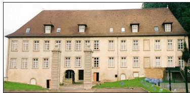
Si la maison de la nation est connue de tous les Turrinoises, combien savent que c'était le château de la comtesse de Musy ?

Veuve depuis 1765, elle affirme son autorité sur les