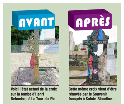
Voici l'état actuel de la croix sur la tombe d'Henri Delombre, à La Tour-du-Pin.