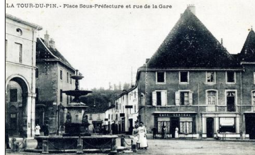
Photo prise vers 1900, depuis la fontaine de l'actuelle place des Halles : cet immeuble du XVI e siècle, remarquable de par sa toiture typique, se situe à l'emplacement d'une ancienne auberge, qui était juste au dehors des enceintes du bourg du Moyen Âge. Le bar, créé en 1850, s'appelait alors "Café central".

L'exposition "Maisons d'hier et d'aujourd'hui", réalisée par l'association "La Tour prend garde", se termine aujourd'hui. Entrée libre, à la maison des Dauphins, de 15 à 18 heures.