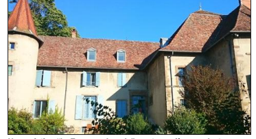
L'association "La Tour prend garde" y eut son siège pendant un temps. À partir de 2007, le château de Châbons a été divisé en plusieurs appartements, aménagés par leurs nouveaux propriétaires.