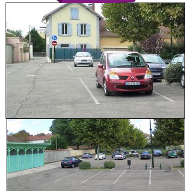
Le chalet du gardien est toujours là. Il a, un temps, abrité les scouts. Sinon, des "bassins populaires", comme il est mentionné sur la carte postale, il ne reste plus que 15 des 69 cabines pour se déshabiller (photo du bas), en bordure de ce qui est devenu le parking du clos Bargillat, derrière la place Carnot.