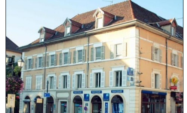
La Tour-du-Pin ayant à accueillir de moins en moins de voyageurs, l'hôtel laisse sa place à "la Maison de l'Amateur" en 1964. Aujourd'hui, il est occupé par une banque et différents cabinets de professions libérales.