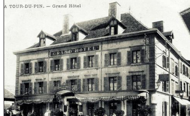
Photo prise vers 1900. Ce bâtiment était une dépendance du couvent des Récollets et devint alors la sous-préfecture et le Grand café. Stendhal descendait dans cet établissement, l'hôtel Chotol, quand il rendait visite à sa sœur, Pauline Perier-Lagrange, qui habitait le château de Thuellin.