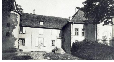
Photo prise vers 1900. Durant le XX e siècle, le château de Châbons a eu de multiples fonctions, servant tour à tour d'école durant la dernière guerre, puis de local pour les scouts ou de départ pour le "défilé de la fête à Dieu".