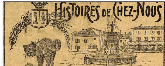
Ce document issu des archives du Dr André Denier est la caricature de la ville, avec le chat et la fontaine de la place Antonin-Dubost. "La Tour prend garde" propose un apéritif "Miron", samedi, entre 18 et 21 heures.

À début du XX e siècle, les Turrinois dégustaient un apéritif appelé "miron". Fait à partir de vin blanc local de piètre qualité, on y ajoutait de la crème de citron dans la proportion d'un quart. Certains utilisaient du pétillant. Si aujourd'hui, on ne trouve plus ces ingrédients, du vin blanc de Jonvieux et un sirop de citron de chez Bigallet permettent de s'en rapprocher. Cet apéritif simple se marie parfaitement avec les chocolats du même nom, nés en 1998. Ils contiennent du citron confit en plus de la nougatine pralinée et de la pâte d'amande.